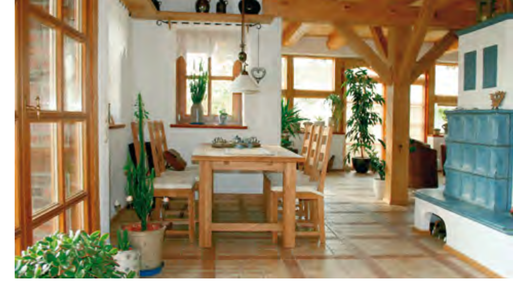
Die Balkendecken und Stützen ermöglichen eine freie Grundrissplanung.